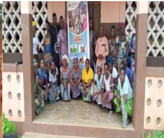
Membres sensibilisés dans la commune de Lokossa