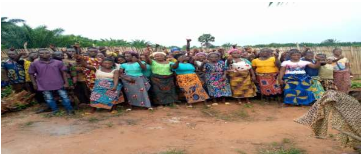
Membres sensibilisés dans la commune d'ALLADA