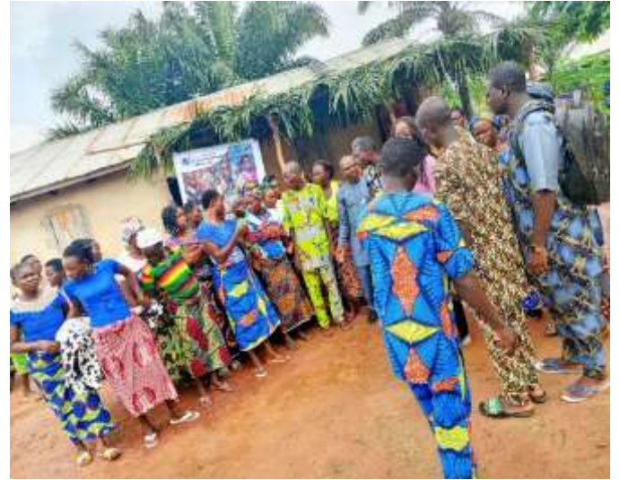
Membres sensibilisés dans la commune de Zogbodomey